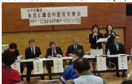
ICT政策を説明。生活の安心・便利を追求しながら、取り残される方を出さないことの重要性も訴える。